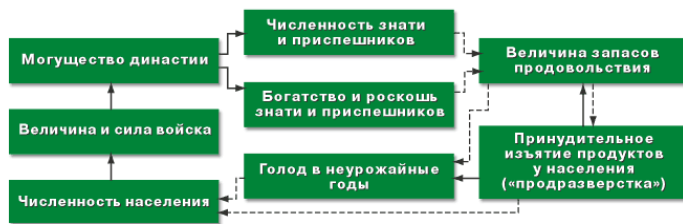
Рис. 3. Негативное влияние роста численности и appetites знати на продовольственную безопасность страны и лояльность населения.

Численность и appetites знати и приспешников приводят также к сокращению запасов продовольствия, что в голодные годы обуславливает массовый голод, мор, вымирание населения, что также ослабляет экономику, силу армии и лояльность населения (см. рис. 3).