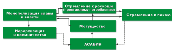
Рис. 1. Причины упадка асабия по Ибн Халдуну (здесь и далее: сплошные стрелки – усиливающие связи, пунктирные – разрушающие связи).

полноту власти династии, о которой речь шла выше.